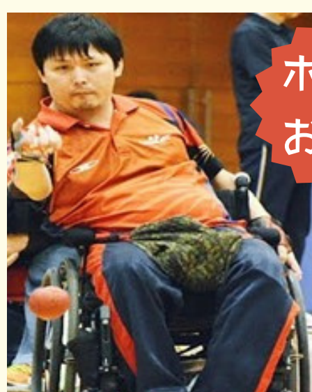
ポッチャ お助け隊