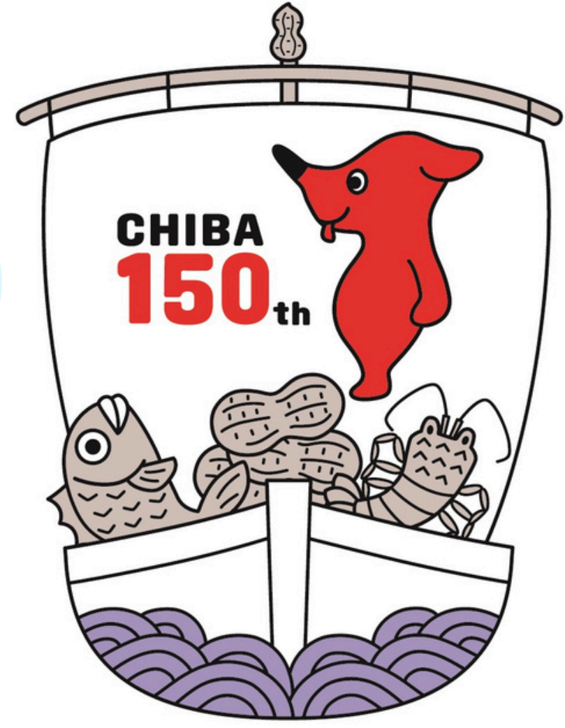
千葉県マスコットキャラクター チーパくん