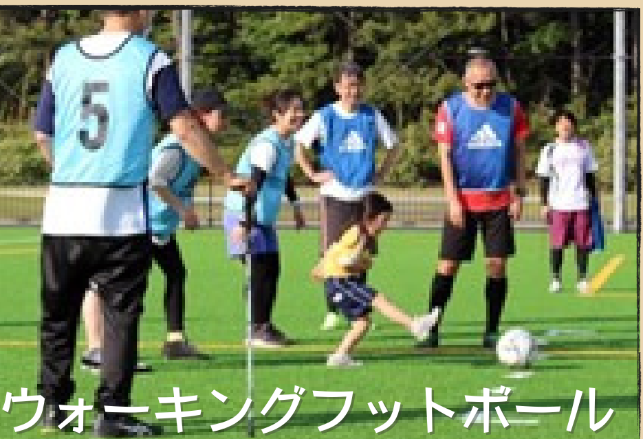
ウォーキングフットボール